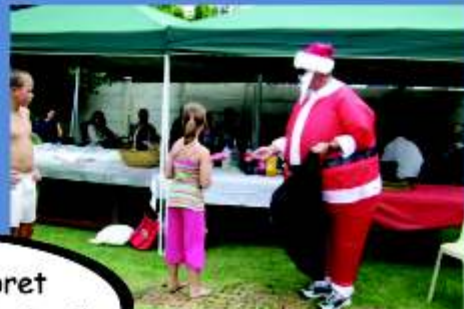
Met soveel pret