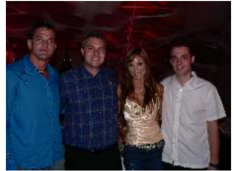
Jacques en Arno by Joost en Amor