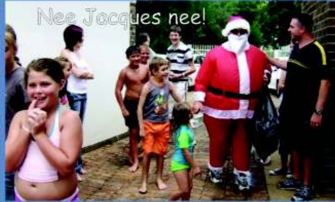
Nee Jacques nee!