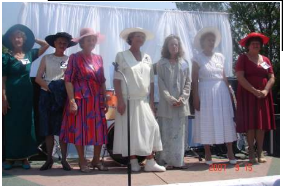
"I'm too sexy for my dress"