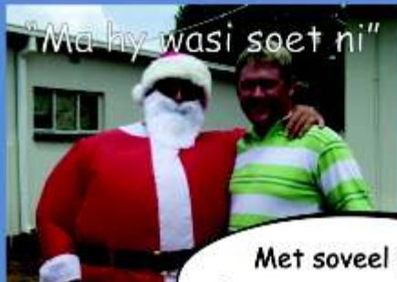
"Ma hy wasi soet ni"