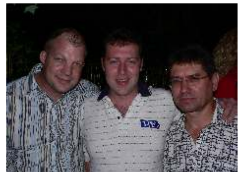
Deel van IFM se span