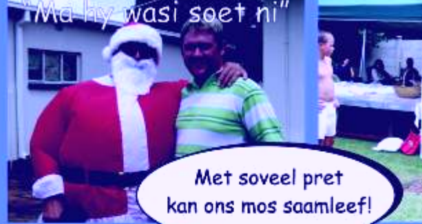
"Ma hy wasi soet ni"