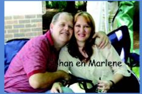
han en Marlene